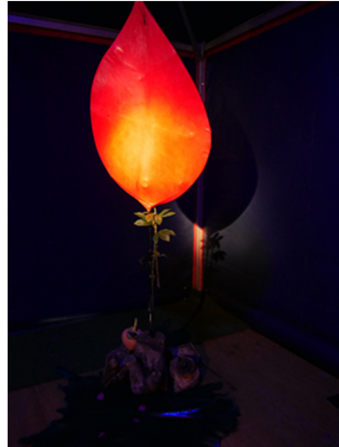
Jard'End - La feuille