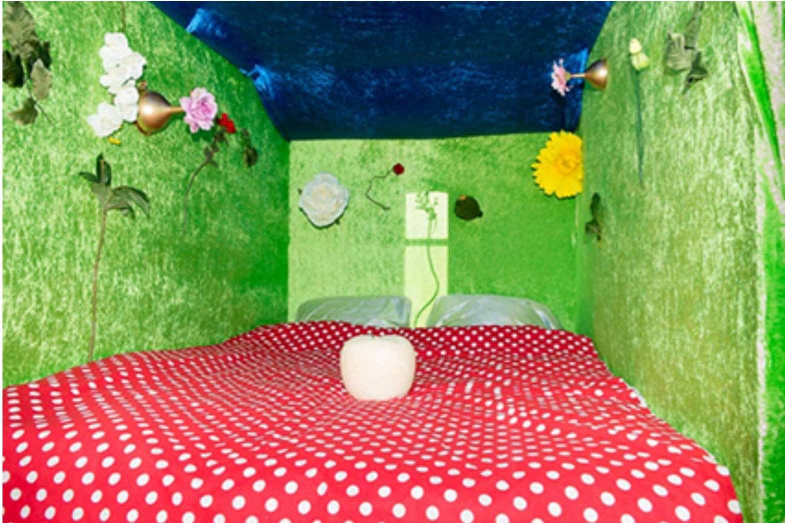
Fragment de Paradis - Le litGénial