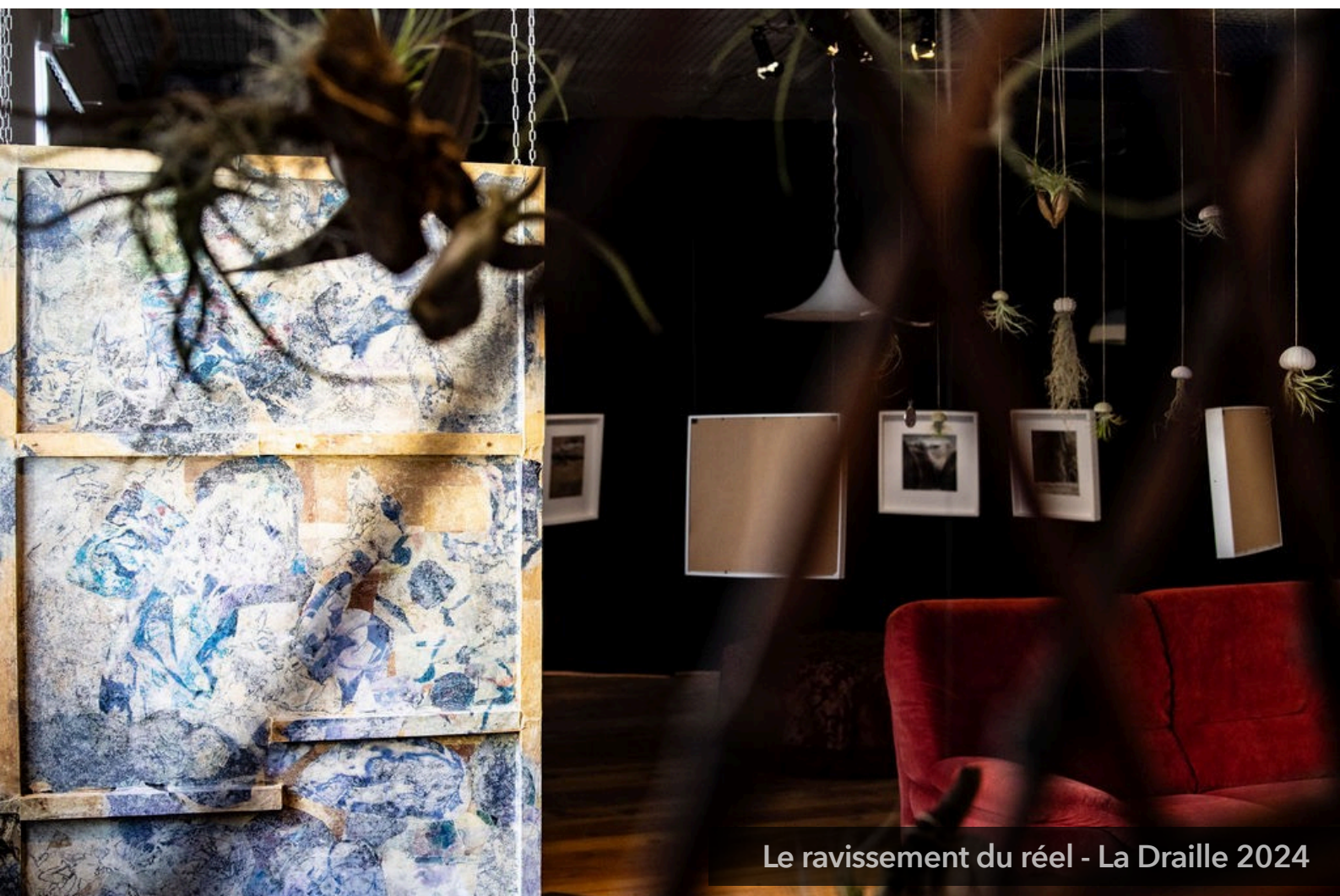
Le ravissement du réel - La Draille 2024

Un espace de restitution vient conclure la visite et le jeu. L'occasion de rencontres, de partages et de découverte.